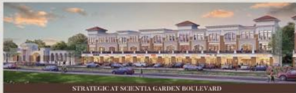
STRATEGIC AT SCIENTIA GARDEN BOULEVARD