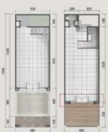
Denah 2 Lantai