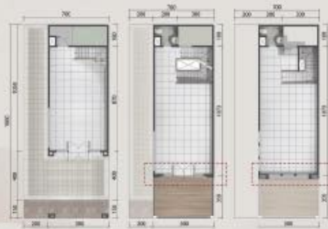
Denah Hook 3 Lantai