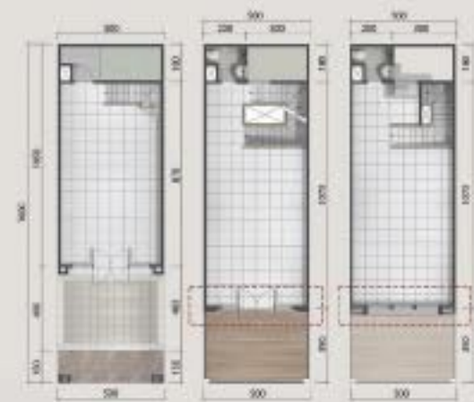
Denah 3 Lantai