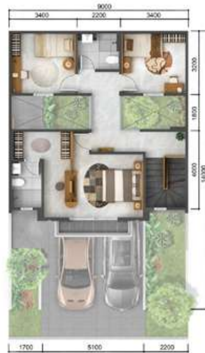
2 nd floor