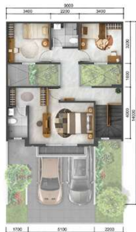
2 nd floor