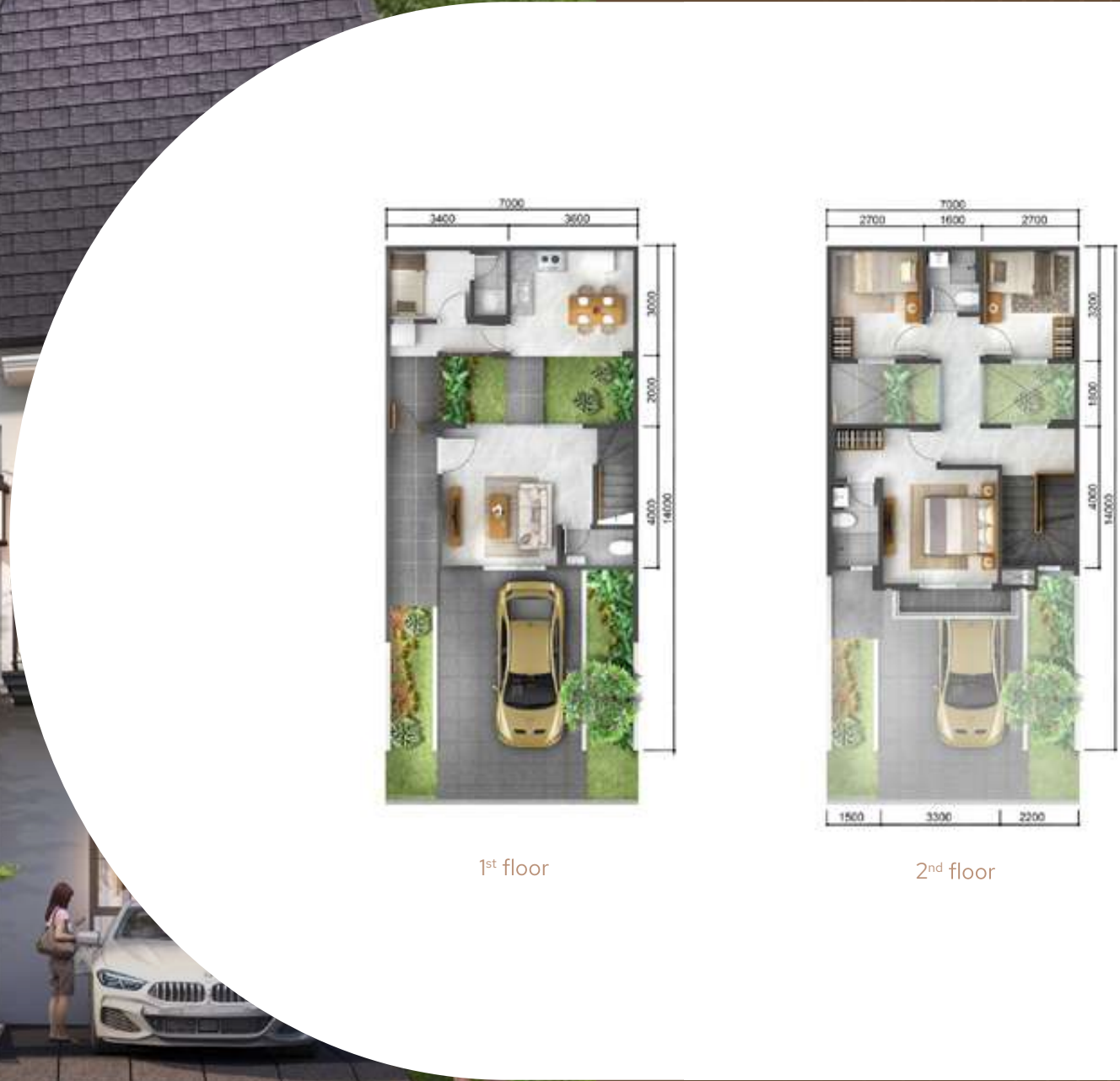
1 st floor

Disclaimer: Seluruh data dan gambar yang tercantum pada brosur ini berdasarkan situasi dan kondisi pada masa persiapan, perubahan dapat terjadi sewaktu - waktu dan merupakan hak penuh pengembang