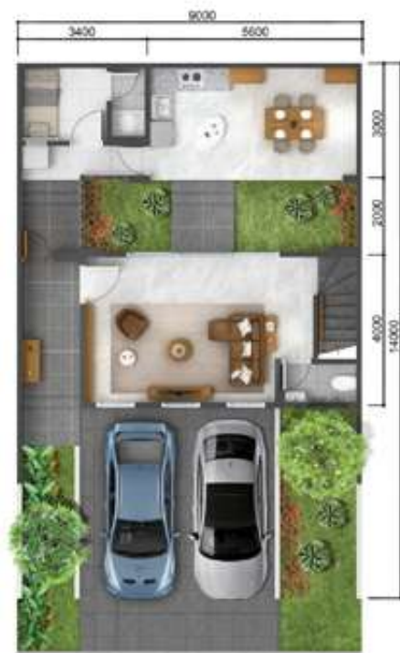
1 st floor