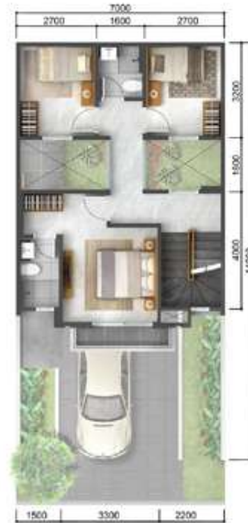
2 nd floor