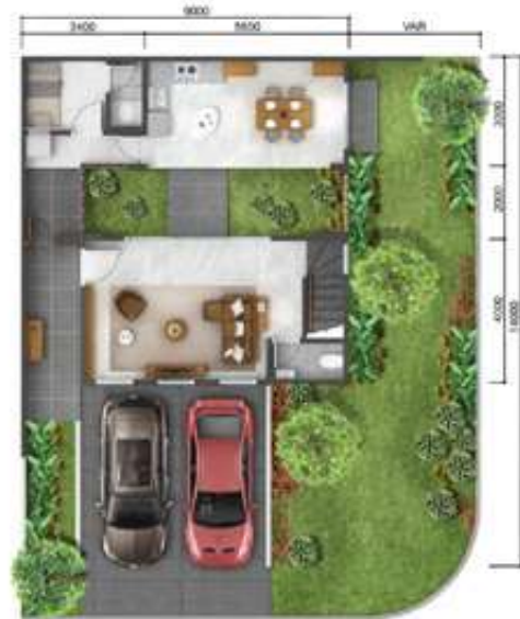
1 st floor