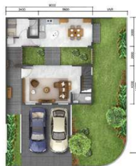
1 st floor