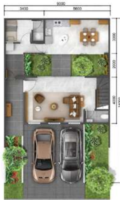
1 st floor