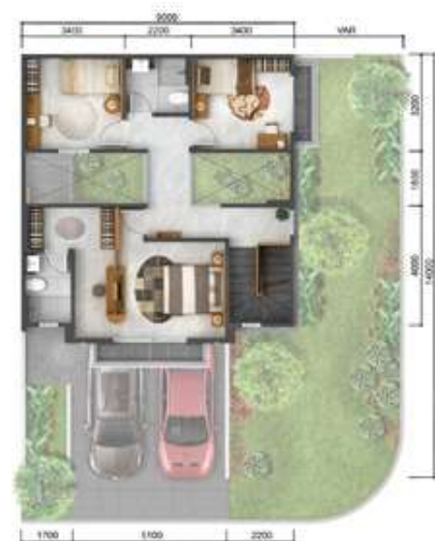
2 nd floor