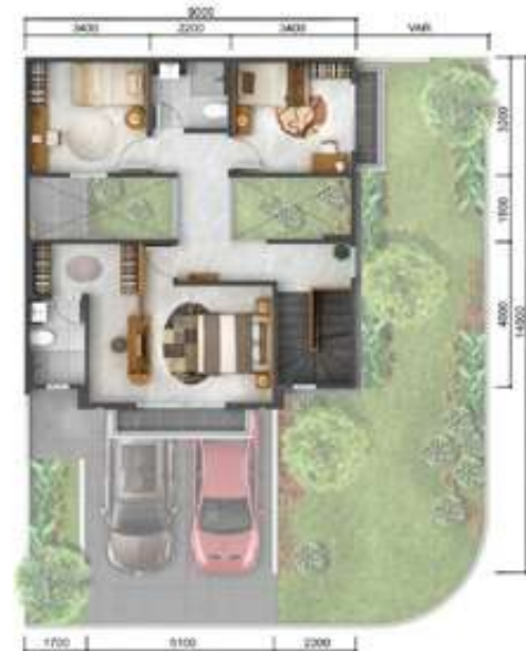
2 nd floor