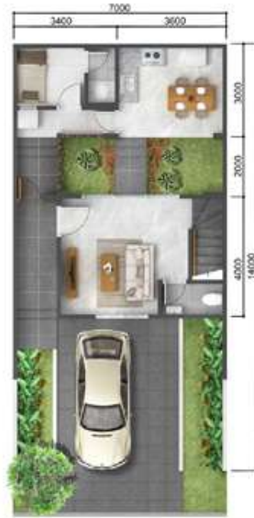
1 st floor